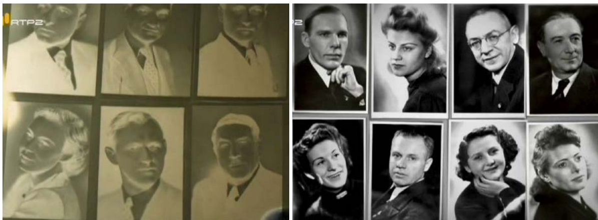
Portraits des pilleurs