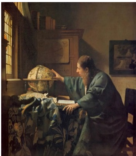
L'Astronome de Vermeer