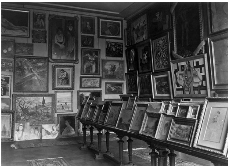
"Salle des martyrs" au Jeu de Paume