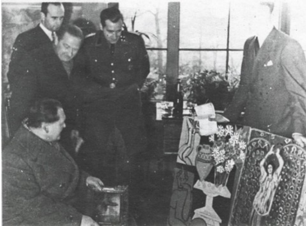
Hermann Göring à la recherche de tableaux pour sa propre collection, 2 décembre 1941.

des œuvres d'art des collections y compris espagnoles. Aucun français n'a été admis à séjourner au Musée pendant ces visites. Le M l Göring emportera demain, dans son train particulier (4 décembre, au soir) les statues provenant de l'hôtel Edouard de Rothschild, l'une d'elles est en plâtre, et une cinquantaine de tableaux - beaucoup sont des tableaux impressionnistes appartenant à l'Collection Rosenberg -